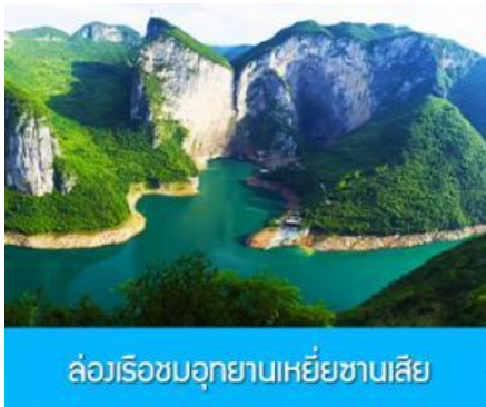
ล่องเรือชมอุทยานเหยี่ยซานเสี๋ย