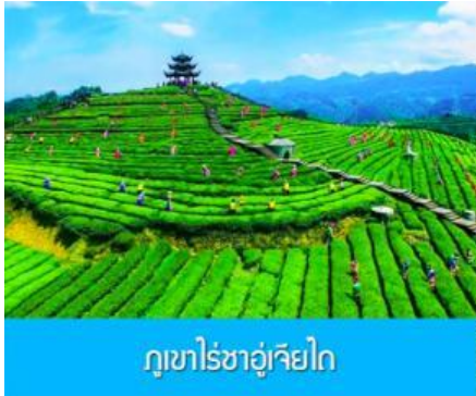
ภูเขาไร่ชาอู่เจียไถ

พักที่ โรงแรม ENSHI XIPU HOTEL ระดับ 4 ดาวท้องถิ่นหรือเทียบเท่าในเมืองเินซือ