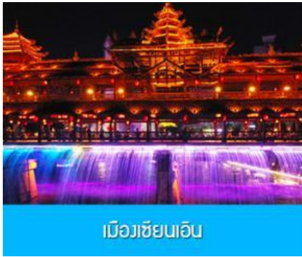
เมืองเซียนเอิน