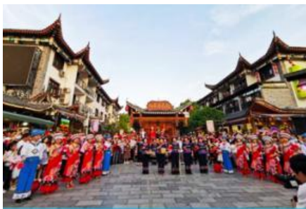
เมืองเทพธิดา