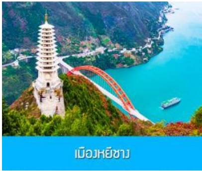
เมืองหยีซัง