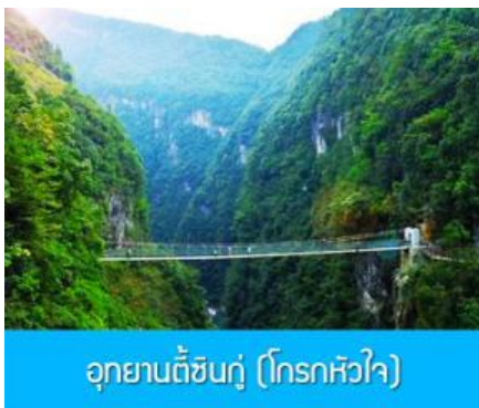
อุทยานตีสันกู่ (โกรกหิวใจ)

พักที่ โรงแรม ENSHI XIPU HOTEL ระดับ 4 ดาวท้องถิ่นหรือเทียบเท่าในเมืองเอินชือ