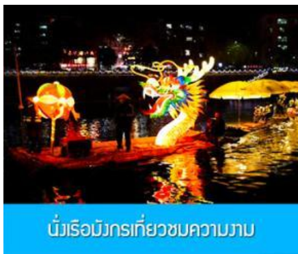
นั่งเรือมังกรที่วิวชมความงาม