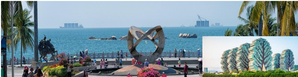
ศิลปินเต็มเหนี่ยวงานรวมมากกว่า 6,000 ทอง ขาดารแห่งนรูปทรงเมเหมือนใคร ตัวอาคารเป็นรูปต้นไม้ยักษ์ตั้งสูงโดดเด่นในเมืองซานย่า

นำท่านเดินทางสู่ อุทยานสุดขอบฟ้าจรดทะเล (เทียนย่าไห่เจี้ยว) หรือแหลมหินเทียนหย่าไต้ (Tianya-Haijiao) ซึ่งแปลว่า "ขอบฟ้าสวรรค์" เป็นหนึ่งในสถานที่ท่องเที่ยวที่มีชื่อเสียงและเป็นที่ยอมรับของคู่แข่งงานคู่รักวัยรุ่น คู่ฮันนีมูนที่มาขอพร เพื่อความสุขในการดำเนินชีวิตคู่ อีสระให้ท่านได้สูดรับลมทะเลอันบริสุทธิ์ พร้อมเพลิดเพลินกับการชมทัศนียภาพอันสวยงาม ทRAYที่งดงาม ทิวทัศน์อันกว้างใหญ่ของมหาสมุทรเบื้องหน้า (ไม่รวมรถอล์ฟ)