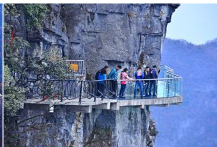
หน้าพลาวยี่ฟ้าทางเดินกระจก