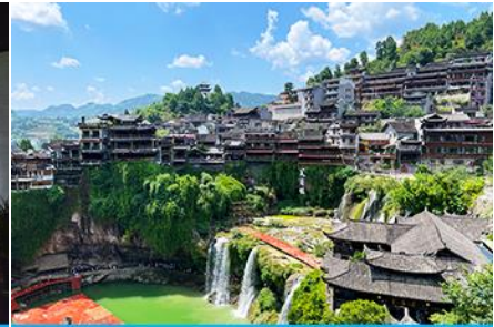
เมืองโบราณฝูหรงเจิน