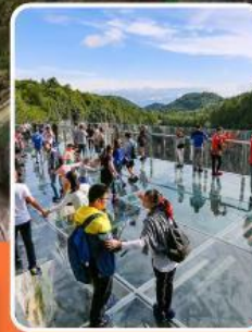
ระเบียบงแกวอู่หลง

ภูเขาหว่าอูซาน (รวมขึ้นกระเช้าไป-กลับ)- อุทยานเขานางฟ้า อุทยานหลุมฟ้าสะพานสวรรค์ - ระเบียบงแกวอู่หลง - รถไฟฟ้าทะลุคัก หงหยาดัง - วัดเป้ากัว - หลวงพ่อโตเล่อซาน - วัดต้าฉือ หมี่แพนด้ายักษ์ ซ้อปั้ง ถนนคนเดินซุนซู่ ไร่กุหลาบ