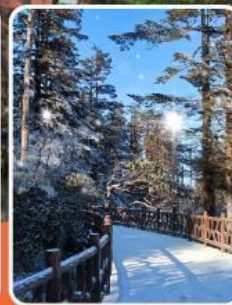
ภูเขาหว่าอูซาน