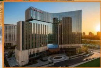
Sheraton Beijing Lize Hotel