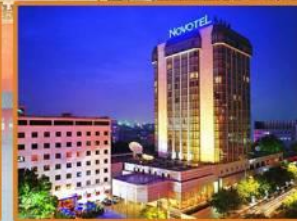
Novotel Beijing Peace