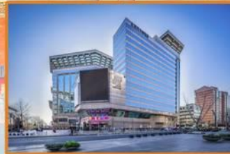
New World Hotel Beijing