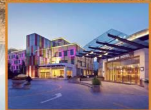
Mercure Beijing City Centre

แพ็คเกจรวมตัวเครื่องบินไป - กลับ โดยสายการบิน Thai Airways พร้อมน้ำหนักกระเป๋า 20 กก.