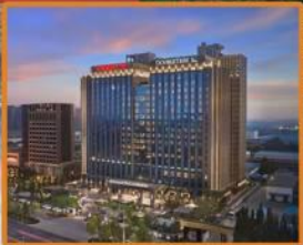
DoubleTree by Hilton Beijing