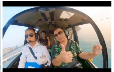
ตั้งภาพฝัน (รวมค่าขึ้นเฮลิคอปเตอร์)

หมายเหตุ** ใช้เวลาในการนั่ง โดยสาร ประมาณ 1 นาทีต่อรอบ และจำกัดผู้โดยสารครั้งละไม่เกิน 3 ท่าน โดยที่มีน้ำหนักรวมทั้งหมดไม่เกิน 200 กก.