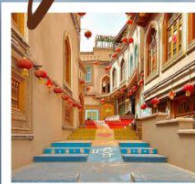
เมืองโบราณคัชการ์