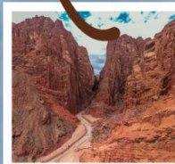
แกรนด์แคนยอนเทียนชาน