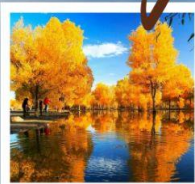
สวนต้นหูหยาง

พิธีเปิดเมืองเก่า / เมืองโบราณคัชการ์ / มัสยิดอีดคาห์ / ถนนคนเดินHandmade / โรงน้ำชาอ๋อยปี / ทะเลสาบไปซาหู่ / ทะเลสาบคาลาคู่เค่อ ภูเขาหิมะ: Muztagh Peak / ทะเลทรายทากลามากัน / จุดชมวิวกะเคแดง / แกรนด์แคนยอนเทียนชาน / สวนต้นหูหยาง / สวนหลงชาน / ตลาดดำปาจา