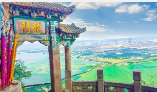
ภูเขาซีซาน