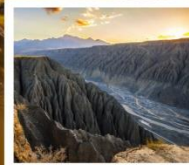
แกรนด์แคนยอนดูซานจื่อ