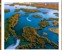
ทะเลสาบอูหลุนกู่

ผ่านทางด่วนทะเลทราย S21 / ทะเลสาบอูหลุนกู่ / ปู่อ๋อจิน / เซาไปซา / กุ่มหญ้าอาเหอถังโก่เก้ / หมู่บ้านเหมอมู่ซุน / คานาสีอ / ทะเลสาบมังกรหลับ / ทะเลสาบเวอดา จุดชมวิวกานาสีอ / ศาลาชมปลา / ล่องเรือทะเลสาบคานาสีอ / หาดห้าสี / เมืองปีศาจ / เมืองกาลามาอี / คาลามาอี / แกรนด์แคนยอนตุ่ซานจื่อ / ตลาดต้าปาจาง