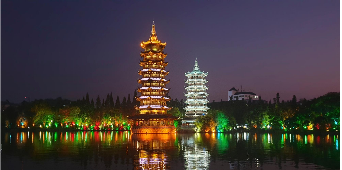
ที่พัก GUILIN EMME HOTEL ระดับ 4* หรือเทียบเท่า

วันที่สอง กุ้ยหลิน - นั่งรถไฟความเร็วสูงไปหนานหนิง - ถ้ำน้ำแข็ง - อุทยานหมิงซื่อ