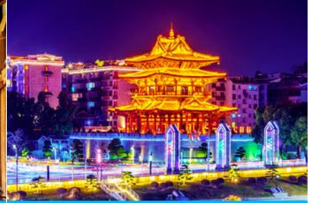
หอเขี้ยวเหยาโหลว

วันที่สี่ เมืองหยางซั่ว –ภูเขาหญือ่ฝง– เมืองโบราณต้าชวี –เมืองกู่ยฺหลิน– หอเขี้ยวเหยาโหลว – ซ้อปั้งย่าน ตงซีเจียง