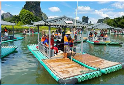
ขึ้นเรือแพชมม่านน้ำหลีเจียง