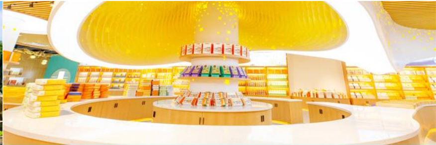
พิพิธภัณฑ์ดอกกุยฮวา