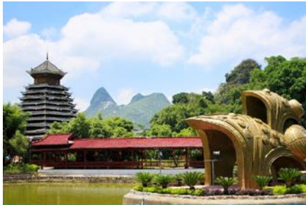
สวนหลิวซานเจีย