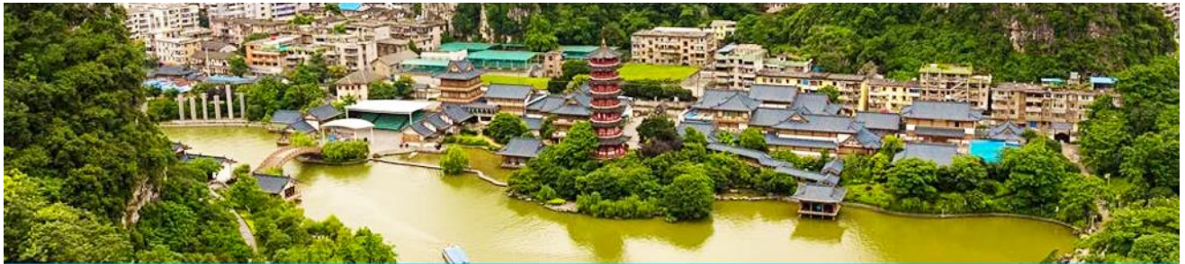
กุ้ยหลิน