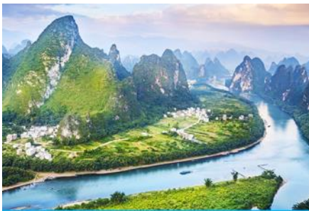
จุดชมวิวม่านน้ำหลีเจียงบนเขาเซียงกง

พักที่ GUILIN VIENNA HOTEL ระดับ 4 ดาวท้องถิ่นหรือเทียบเท่าใน เมืองกุ้ยหลิน