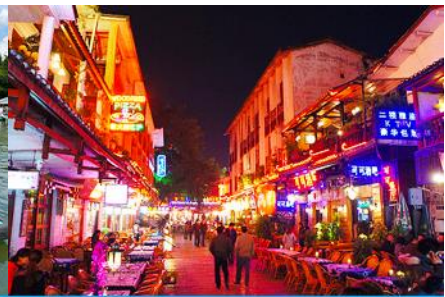
ถนนคนเดิน ซิเคียวหรือถนนฝรั่ง