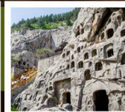
ถ้ำหินหลงเหมิน