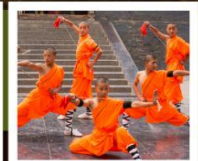
โชว์เล่าหลิน

PERIOD 1 : 9 - 14 สิงหาคม | PERIOD 2 : 18 - 23 ตุลาคม 2567