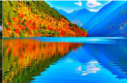
ทะเลสาบแพนด้า

วันที่สาม อุทยานจิวจ้ายโกว –(รถเมล์ในอุทยาน) ทะเลสาบทะเลยาว–ทะเลสาบห้าสี- น้ำตกธารไข่มุก–ทะเลสาบนกยูง– ทะเลสาบแพนด้า