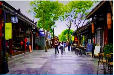
ชอยกวาง ชอยเคบ และชอยบ่อน้ำ

วันที่หก เมืองเฉิงตู – วัดเจาเจี๋ย- ถนนโบราณจิ้นหลี่-ชอยกวางชอยเคบ-SPK Global Center – ชมแสงสีบนตึกแฝด – เดินทางกลับกรุงเทพฯ