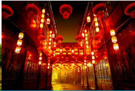
ถนนโบราณสถานจิ้นหลี่