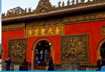
วัดต้าฉือ