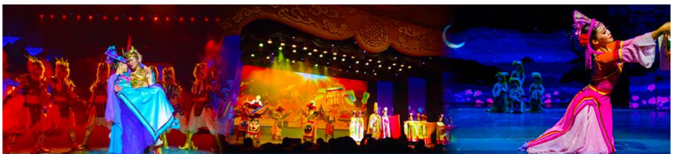
Romantic Show of Jiuzhai

หลังอาหารนำท่านสามารถเลือกซื้อรายการทัวร์เสริม พิเศษการแสดง ชุด Romantic Show of Jiuzhai