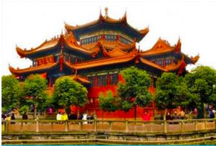
วัดเจาเจี๋ย