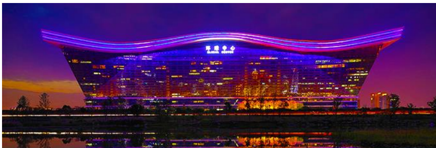
Chengdu new century global center