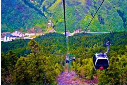
นั่งกระเช้าขึ้นสู่อุทยานหวงหลง

พักที่ JIUYUAN HOTEL ระดับ 4 ดาวท้องถิ่นหรือเทียบเท่าในอุทยานจิวจ้ายโกว