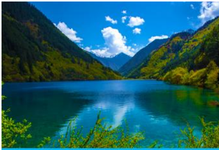
ทะเลสาบแรด (RHINO LAKE)

ฤดูกาลผลิ ด้วยความสวยงามจึงทำให้อูทยานแห่งชาติจิวจ้ายโกว ได้ถูกขึ้นทะเบียนเป็นมรดกโลกทางธรรมชาติ ในปีค.ศ. 1992