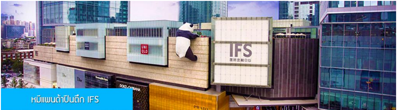
หมีแพนด้าปีนตึก IFS