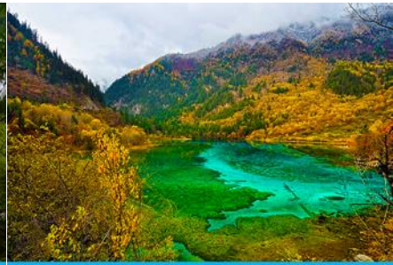
ทะเลสาบนกยูง (PEACOCK LAKE)