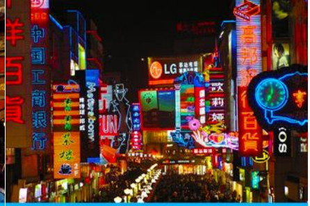
ถนนคนเดินชุนซีอู่

วันที่ห้า เมืองเม่าเจียน – ตุ๊กตาหมีนอนเซลฟี- ถนนไท่กู่หลี่ – วัดต้าฉือ - ซุปปิ้งถนนชุนซีอู่