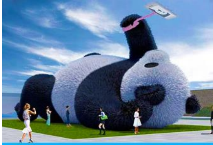
ตุ๊กตาแพนด้านอนเซลฟี

พักที่ MAOXIAN INTER HOTEL โรงแรมระดับ 4 ดาวหรือเทียบเท่าในเมืองเม่าเจียน