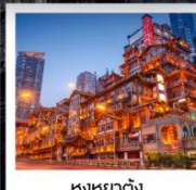
ทิวทัศน์