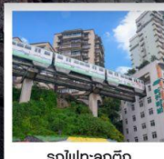
รถไฟฟ้าลัดคิว

ทัวร์คุณธรรม ไปลงร้านช้อปปิ้ง • ไม่ขายออฟชั่น