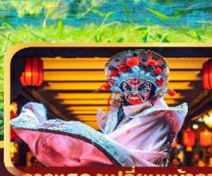
การแสดงเปลี่ยนหน้ากาก