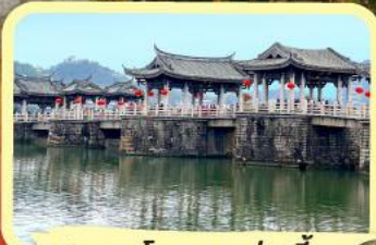
• สะพานโบราณกว่างจี้