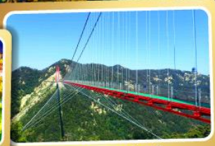
สะพานแขวนอ้ายจ้าย