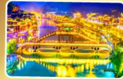
เมืองโบราณเฟิงหวง