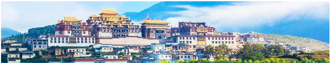
เมืองโบราณเซงกรีล่า

จากนั้นนำท่านชม หมู่บ้านซีโจวหรือหมู่บ้านชาวปู้ ชนพื้นเมืองที่สำคัญของเมือง ชมการแสดงของชนชาติป๋ายพร้อมชิมชาสามแก้ว เพื่อรำลึกถึงวิถีชีวิตและการเกิดมาเป็นมนุษย์ของตนเอง ซึ่งถือเป็นเอกลักษณ์ของชนชาวปู้ ที่หาดูได้ยาก