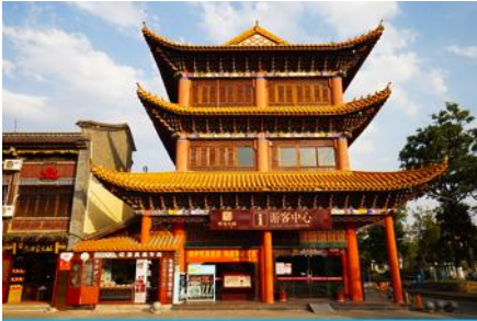
เมืองโบราณกวนตุ๋

พักที่ FEI LONG HOTEL ระดับ 4 ดาว หรือเทียบเท่าในเมืองต้าหลี่