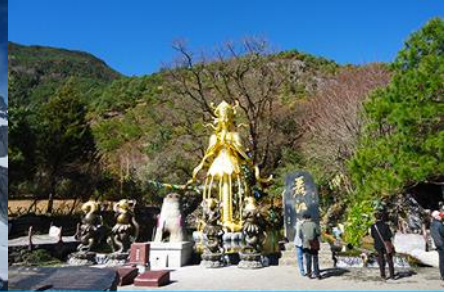
อุทยานน้ำหยก