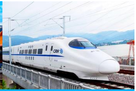
บั้งรถไฟความเร็วสูง