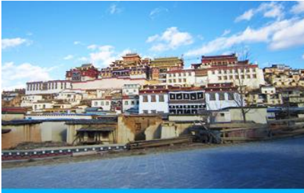
วัดลามะชวงจ้านหลิง