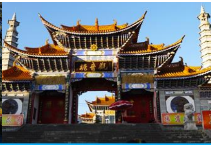
วัดเจ้าแม่กวนอิมเปลงกาย