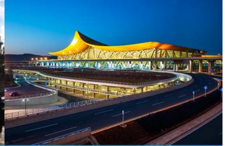
สนามบินเมืองคุนหมิง