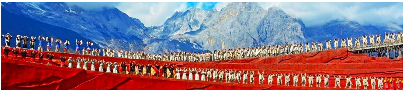
การแสดง IMPRESSION LIJIANG

ชมการแสดง IMPRESSION LIJIANG โชว์อันยิ่งใหญ่โดยผู้กำกับชื่อดังของโลก “จาง อี้โหมว” ได้เนรมิตให้ภูเขาหิมะมังกรหยกเป็นฉากหลัง และบริเวณทุ่งหญ้าเป็นเวทีการแสดง โดยใช้นักแสดงกว่า 600 ชีวิต แสง สี เสียง การแต่งกายตระการตา เล่าเรื่องราวชีวิตความเป็นอยู่ และชาวเผ่าต่างๆของเมืองลี่เจียง