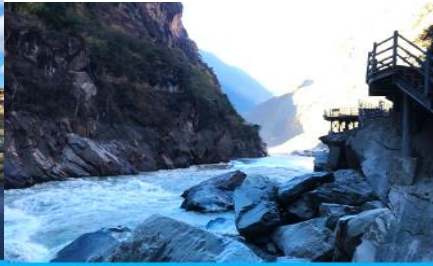
ช่องแคบเล็กระโจน