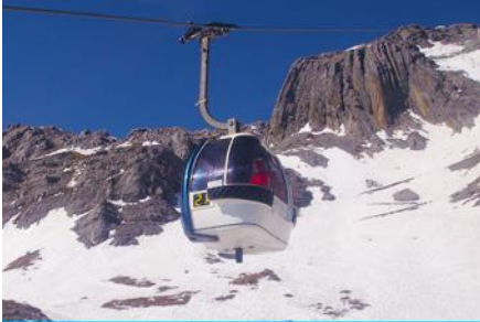
ภูเขาหิมะมังกรหยก (นั่งกระเช้าใหญ่)

ที่พัก FENG HUANG HOTEL ระดับ 4 ดาว หรือเทียบเท่าเมืองลี่เจียง