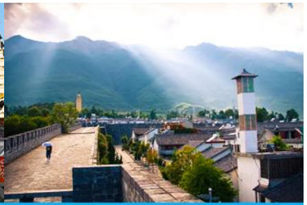
หมู่บ้านซีโจว(หมู่บ้านชาวปู้)