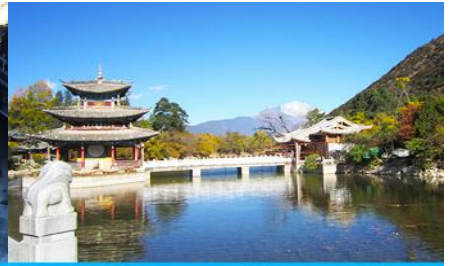
สะพานมังกรดำ