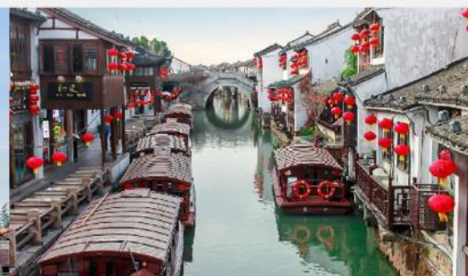
ถนนโบราณชานตางเจีย