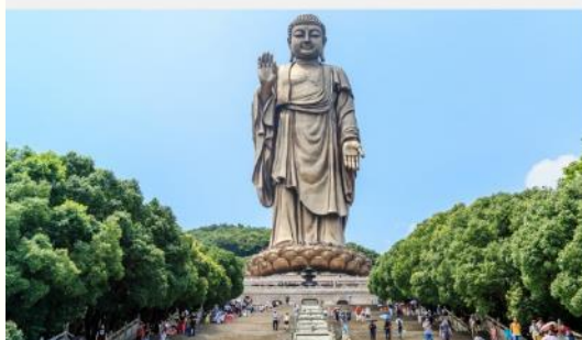
พระใหญ่หลิงซานต้าฝอ