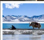
ทะเลสาบน้ำมูซิว