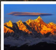
เขานานเจียปาหว่า