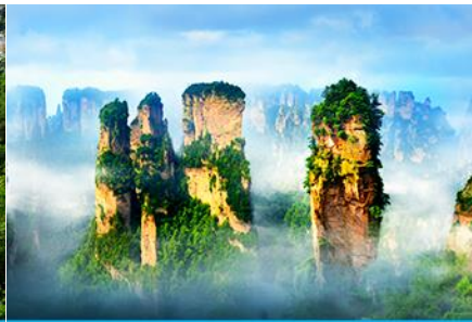
ภูเขาอวตาร

วันที่สี่ เมืองโบราณฝูหรงเจิ้น –จางเจียเจี๋ย –พิพิธภัณฑ์ภาพหินทราย-ขึ้นลิฟท์แก้ว เทียนเขาเทียนจื่อซาน (เขาอวตาร) คั่นนั้นนอนบนเขา ฝ่งหยวนเจียเจี๋ย