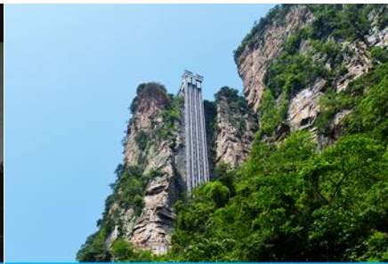
ลิฟท์แก้วไปหลาง