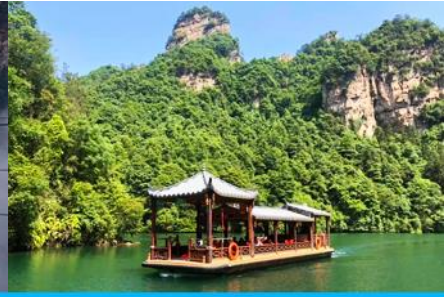
ล่องเรือทะเลสาบ เป้าเฟิงหู

วันที่ห้า ชมพระอาทิตย์ขึ้น-เขาเทียนจื่อซาน(อวตาร) นั่งกระเช้าลงจากเขา-เมืองจางเจียเจี๋ย – เลือกซื้อโปรแกรมทัวร์เสริม ออฟชั่น สะพานกระจกข้ามหุบเขาแกรนด์แคนยอน-เดินทางกลับเมืองหยี่ชัง