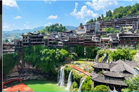
เมืองโบราณฝูหรงเจิน