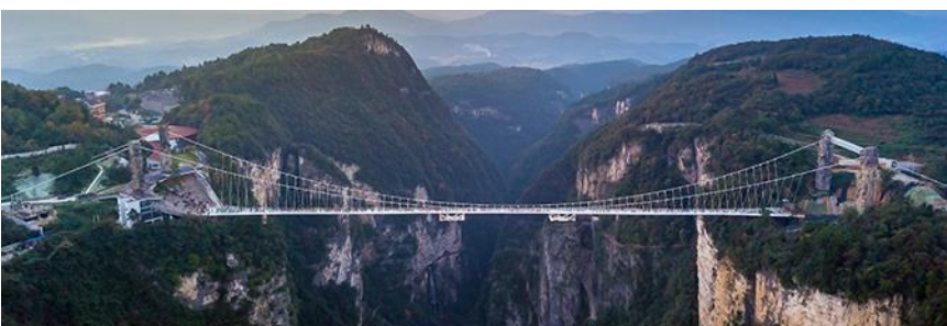
สะพานกระจกจางเจียเจี๋ย

อัตราค่าบริการสำหรับโปรแกรมเสริมการแสดงชุด The love Story of Wooden man and Fairy Fox ท่านละ 400 หยวน (หรือ 2,000 บาทขึ้นอยู่กับอัตราแลกเปลี่ยน) ระยะเวลาที่ใช้ในการเที่ยวชมการแสดง ประมาณ 3 ชั่วโมง รวมเวลาเดินทางไป กลับค่าบริการรวม ค่าบัตรเข้าชม ค่ารถรับ ส่ง และค่าน้ำทิพย์ของไคด์ท้องถิ่น พักที่ GUIYUANZHENPIN HOTEL โรงแรมระดับ 4 ดาวหรือเทียบเท่า