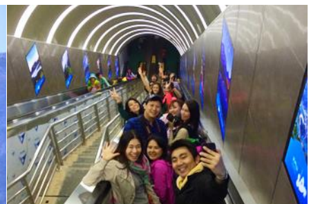
บันไดเลื่อนกะลุกซา