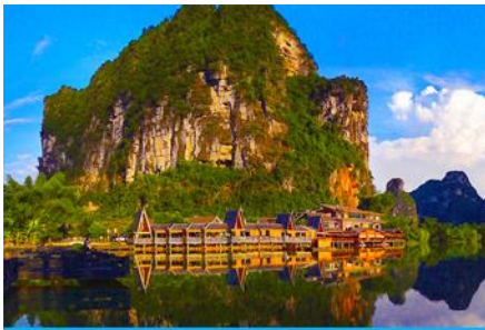
อุทยานหมิงชื่อ