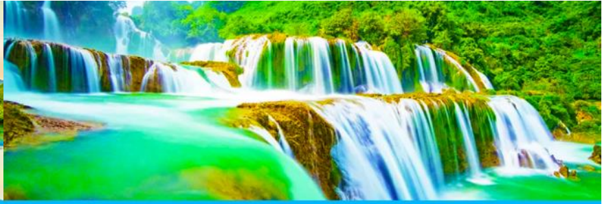
หุบเขาทางหลิงแกรนด์แคนย่อน