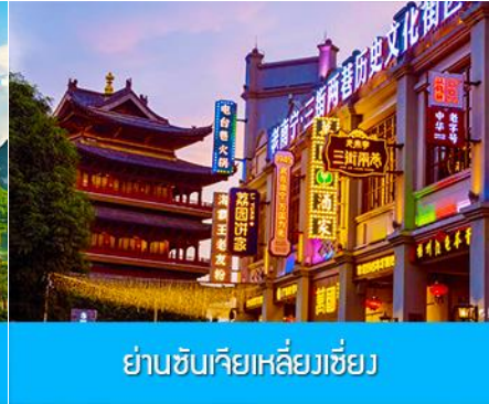
ย่านชุนเจียเหลียงเจียง