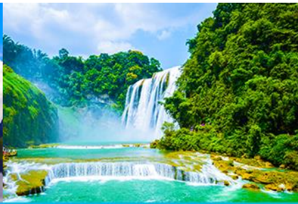
น้ำตกต่อเทียน