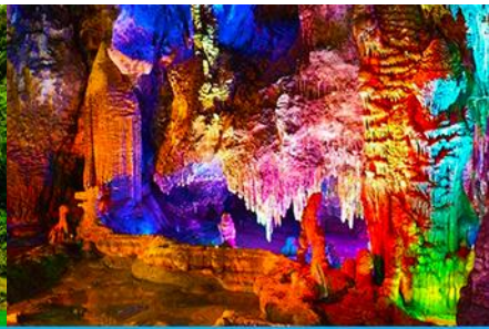
ถ้ำน้ำแข็งหลงกวง