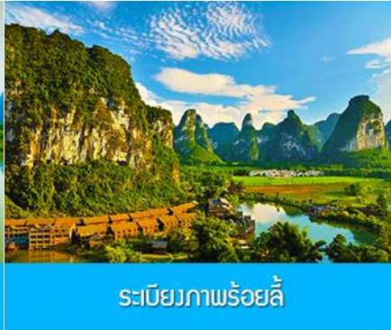
ระเบียงภาพร้อยลี่