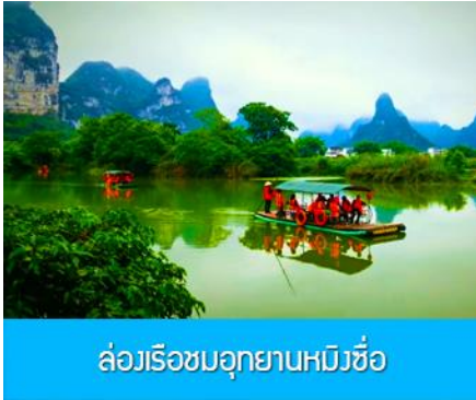
ล่องเรือชมอุทยานหมิงชื่อ