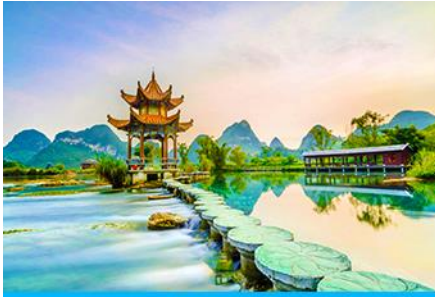
สวนน้ำพุเอ้อฉวน