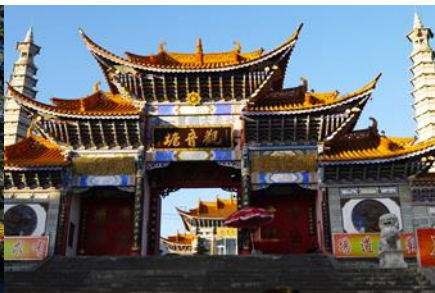
วัดเจ้าแม่กวนอิมเปลงกาย