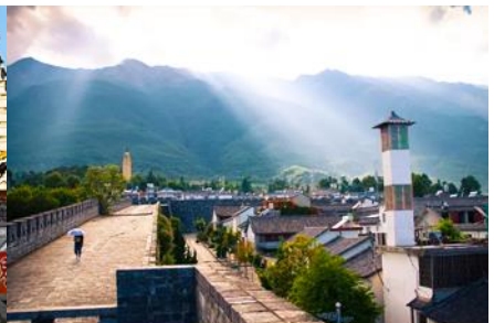
หมู่บ้านซีโจว(หมู่บ้านชาวยุ่)