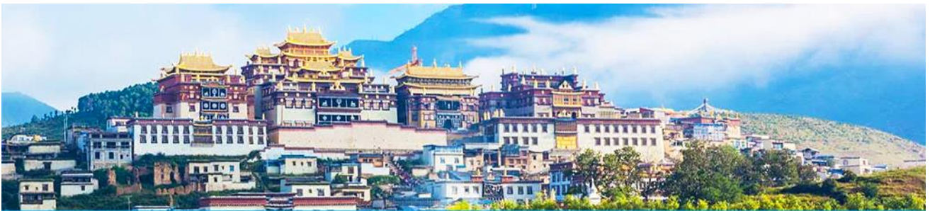
เมืองโบราณแซงกริล่า

จากนั้นนำท่านชม หมู่บ้านซีโจวหรือหมู่บ้านชาวไป๋ ชนพื้นเมืองที่สำคัญของเมือง ชมการแสดงของชนชาติป้าพร้อมชิมชาสามแก้ว เพื่อรำลึกถึงวิถีชีวิตและการเกิดมาเป็นมนุษย์ของตนเอง ซึ่งถือเป็นเอกลักษณ์ของชนชาวไป๋ที่หาดูได้ยาก