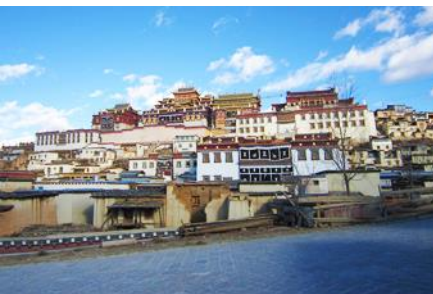
วัดลามะชวงจันหลิว

ที่พัก GRACE HOTEL ระดับ 4 ดาว หรือเทียบเท่าเมืองจงเตี้ยน หรือแซงกริล่า