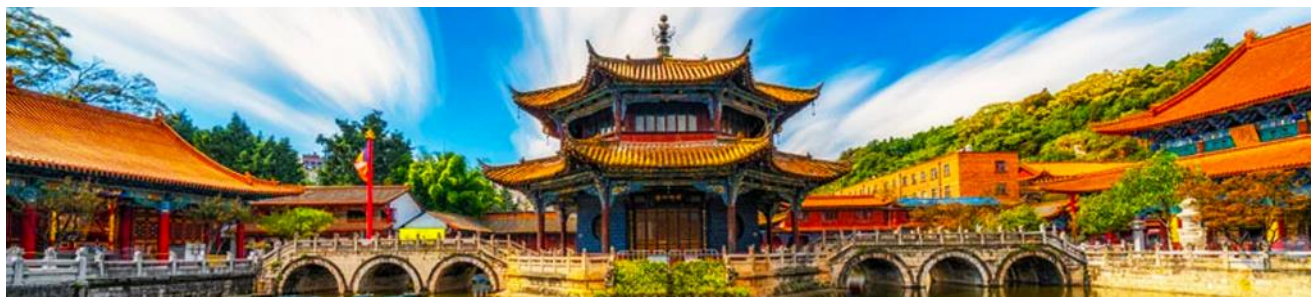
วัดหยวนกวาง

ค่ำ รับประทานอาหารค่ำ ณ ภัตตาคาร พักที่ VIENNA HOTEL ระดับ 4 ดาว หรือเทียบเท่าในเมืองคุนหมิง