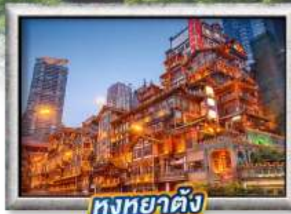
หงหย้าตั้ง