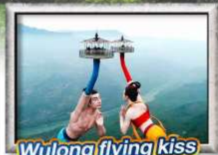
Wulong flying kiss

เมนูพิเศษ! สุกี๋หมาล่าวงซึ่ง, เปิดปิ้งกั๊ง