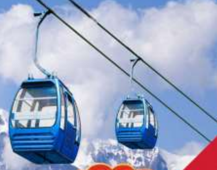
ภูเขาหิมะเจียวจื่อ