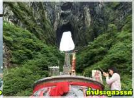
ถ้าประตูละคร

บริการอาหารค่ำ ณ ภัตตาคาร พิเศษ !! บริการท่านด้วยเมนู ปิ้งย่างสไตล์เกาหลี ( มีที่ 3 )