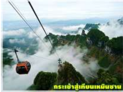
กระเช้าสู่เทียนเหมินซาน