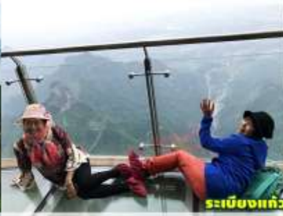
ระเบียงแก้ว