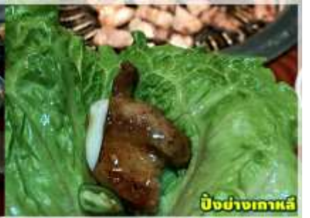
ปิ้งย่างเกาหลี

นำท่านเดินทางสู่ที่พัก Jinhua hotel ระดับ 4 ดาว หรือระดับเทียบเท่า