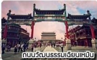
ถนนวัฒนธรรมเจียนเหมิน