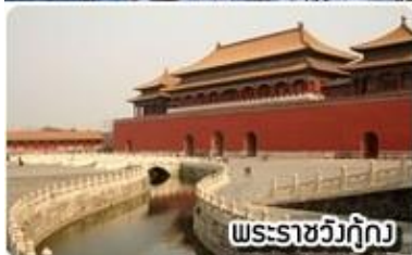
พระราชวังฤดูหนาว