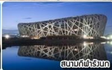
สนามกีฬาโอลิมปิก