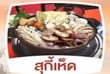
สุกั้หืด