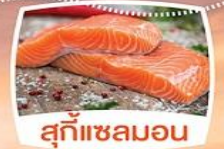
สุกั้แซลมอน