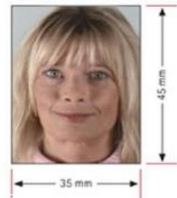
รูปถ่ายมาตรฐาน