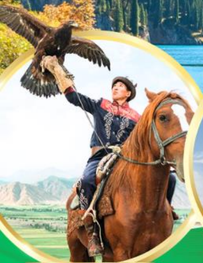
ชมโซว์นกอินทรี