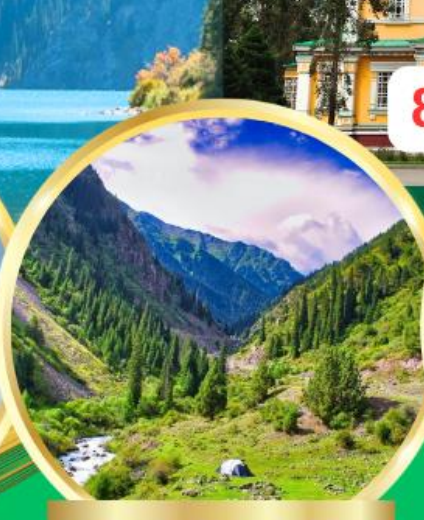
Ala Archa National Park