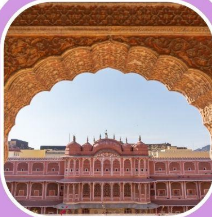
พระราชวังและ พิพิธภัณฑ์เมือง