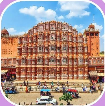
พระราชวัง แห่งสายลม

The world is a book, and those who do not travel read only one page.