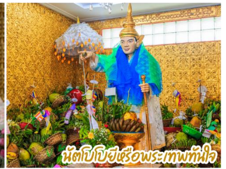
เจดีย์โบตาทาวน์ (BOTAHTAUNG PAGODA)

จากนั้นนำท่านชม ตึกเก่า The Secretariat Yangon (หรือที่รู้จักในชื่อ Ministers' Building) (อดีตที่ทำการรัฐบาลพม่า) *รวมค่าเข้าชม คือหนึ่งในแลนด์มาร์กทางประวัติศาสตร์และสถาปัตยกรรมยุคอาณานิคมที่สำคัญและยิ่งใหญ่ที่สุดในย่างกุ้ง ประเทศเมียนมา ตึกอิฐสีส้มแดงสลักเหลืองแห่งนี้เคยเป็นที่ทำการของรัฐบาลอังกฤษในช่วงยุคอาณานิคม และเป็นสถานที่เกิดเหตุการณ์ลอบสังหารนายพลองซาน บิดาแห่งเอกราชของเมียนมา สตีลวิกตอเรียน-โคโลเนียล: ออกแบบโดยสถาปนิกชาวอังกฤษ Henry Hoyne-Fox โดดเด่นด้วยการใช้อิฐสีแดง สลักเหลือง และการสร้างอาคารเป็นรูปตัว U โอบล้อมพื้นที่เกือบ 16 เอเคอร์ (ประมาณ 40 ไร่) ใจกลางเมืองย่างกุ้ง