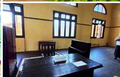
ตึกเก่า The Secretariat Yangon