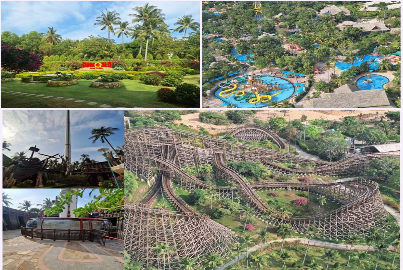
ได้เวลาอันสมควร นำท่านนั่งกระเช้ากลับสู่ฝั่งฟูกีวก

นำท่าน ชมสวนน้ำ และสวนสนุก Aquatopia Park ที่ตั้งอยู่บนเกาะฮอนเทิม (Hon Thom) ประกอบไปด้วยสวนน้ำขนาดใหญ่ และเครื่องเล่นมากมายให้ท่านได้เลือกเล่นได้ตามใจชอบ สวนน้ำ Aquatopia ตั้งอยู่ ทางตอนใต้ของเกาะฟูกีวก ถือเป็นสวนน้ำที่ใหญ่ที่สุดในเอเชียตะวันออกเฉียงใต้ที่มีเครื่องเล่นที่ทันสมัยมากกว่า 20 ชนิด นอกจากโซนสวนน้ำที่เหมาะสมสำหรับครอบครัวแล้ว Aquatopia Park ยังมีเครื่องเล่นที่น่าตื่นเต้นอีกมากมายเช่น รถไฟรางไม้ Eagle Eye ชมวิว 360 องศา เป็นต้น ให้ท่านได้เลือกเฟลิตเฟลิติน รวมไปถึงร้านค้าจำหน่ายของฝาก และร้านอาหารมากมายให้เลือกซื้อ ระหว่างเดินเที่ยวในสวนสนุกแห่งนี้ (กรณีท่านที่ต้องการเล่นน้ำ แนะนำให้ท่านนำชุดไปเปลี่ยน)