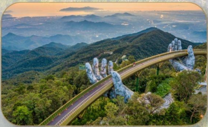
สะพานมือทองคำ