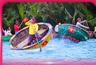
ล่องเรือกระดัง หมู่บ้านกิมทาน