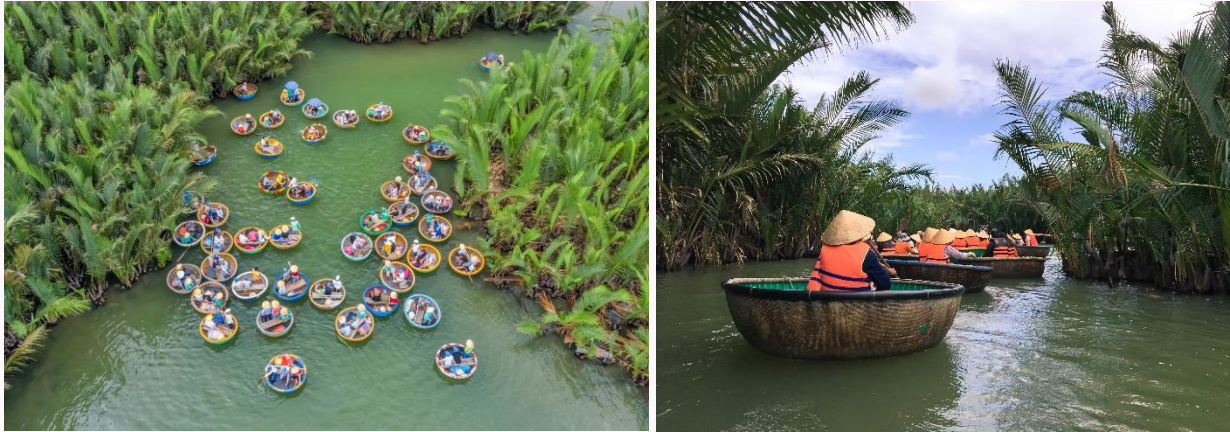
เที่ยวชม เมืองมรดกโลกทางวัฒนธรรมฮอยอัน (HOI AN ANCIENT TOWN)