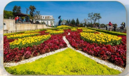
สวนดอกไม้ Le Jardin D'Amour