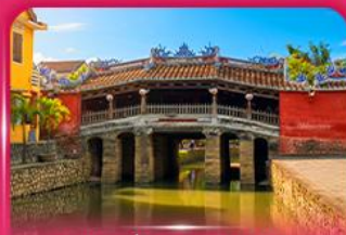
สะพานญี่ปุ่นโบราณ ฮอยอัน