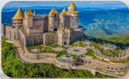
ปราสาทจันทร

ท่าข้ามนั่งกระเช้ายาวที่สุดในโลกได้รับการบันทึกสถิติโดย WORLD RECORD ประเภท NON STOP กระเช้านี้มีความยาวถึง 5042 เมตร