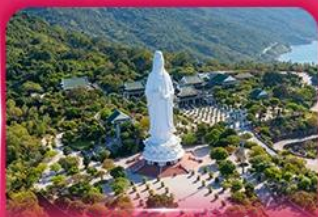
องค์กวนอิม วัดหลันอิ่ง