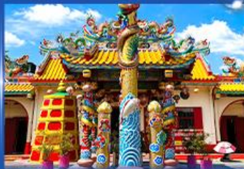
วอพรศาลเจ้าท่ามกั๋นเกี๋ยง