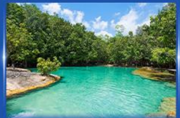
สระมรกต กระบี่