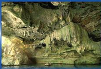
ถ้ำลือชาถอบ Unseen Thailand