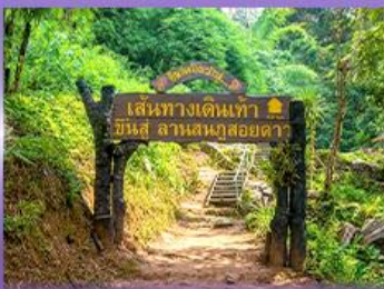
พีชพ 5 เป็นวัดใจ