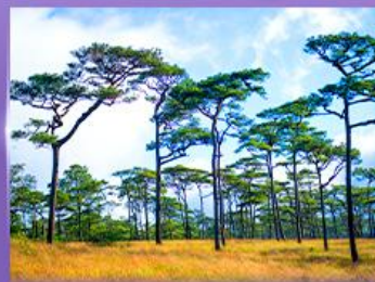
ลานสนกุสอยดาว