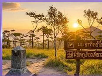
ชมพระอาทิตย์ขึ้น กุสอยดาว