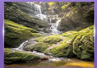
น้ำตกสายทิพย์