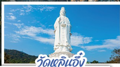
วัดเขลิแอง