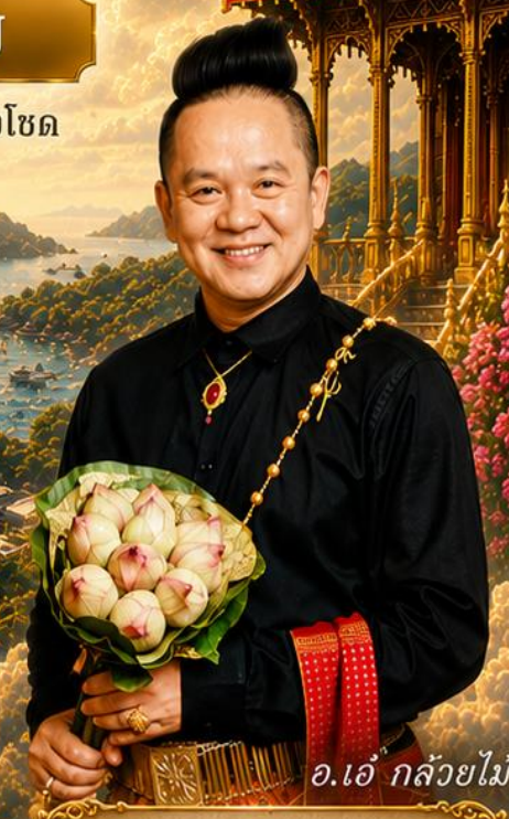
อ.เอ๋ กล้วยไม้