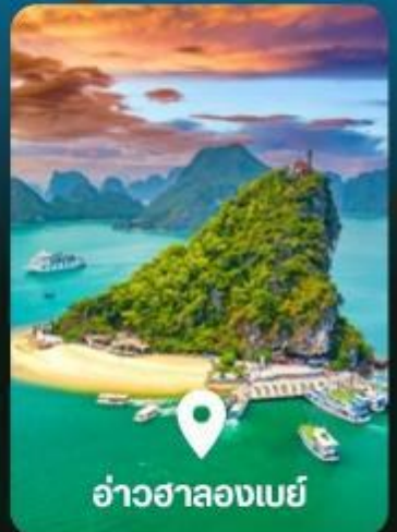
อ่าวฮาลองเบย์