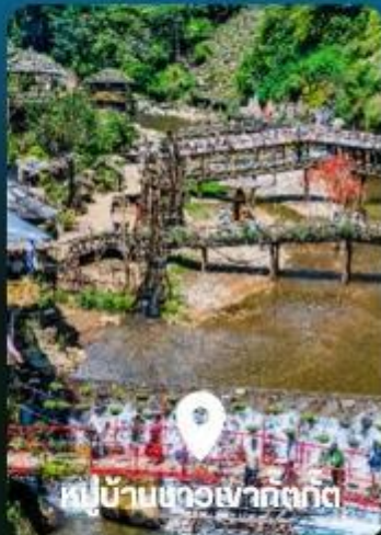
หมู่บ้านชอซาททท