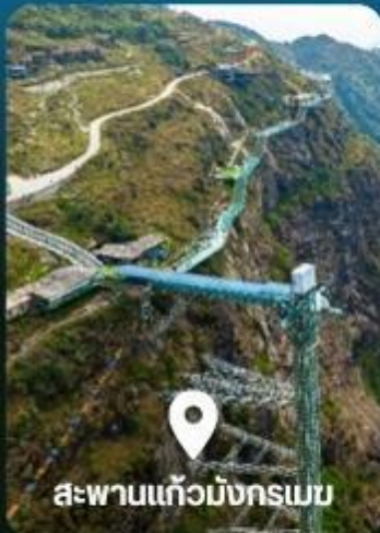
สะพานแก้วมิงกรเมบ