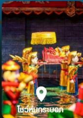
โชว์หุ่นกระบอก