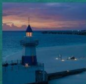
Light House Restaurant