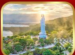
ขอพรทวนอิม วัดหลินอิ่ง