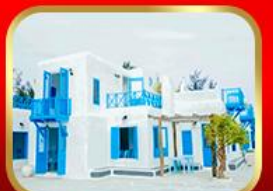
คาเฟ่ Son Tra Marina