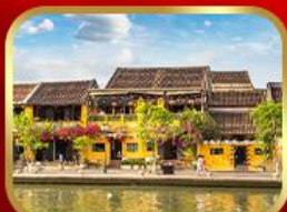
เที่ยวเมืองเก่าฮอยอัน