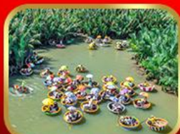
ล่องเรือกระดิ่งกัมทาน