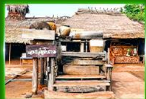
บ่อเกลือ