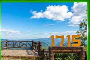
จุดชมวิว 1715