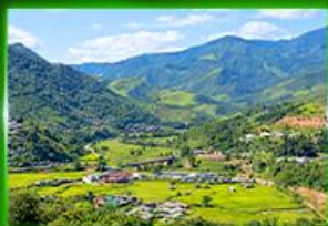
หมู่บ้านสะปัน