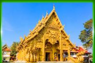
วัดศรีพันต้น