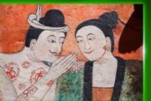
หมู่บ้านย่าม่าน วัดภูมินทร์