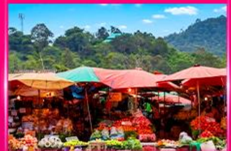
ตลาดดอยมูเซอ