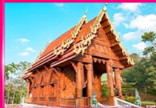
โบสถ์ไม้สักทอง