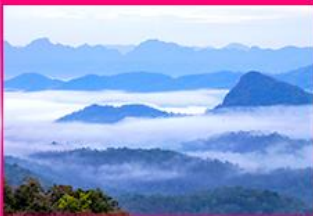
ทะเลหมอก ดอยหัวหมอก