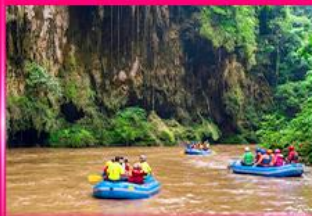
ส่องแก่ง ทิวอลู - ทิวอลู