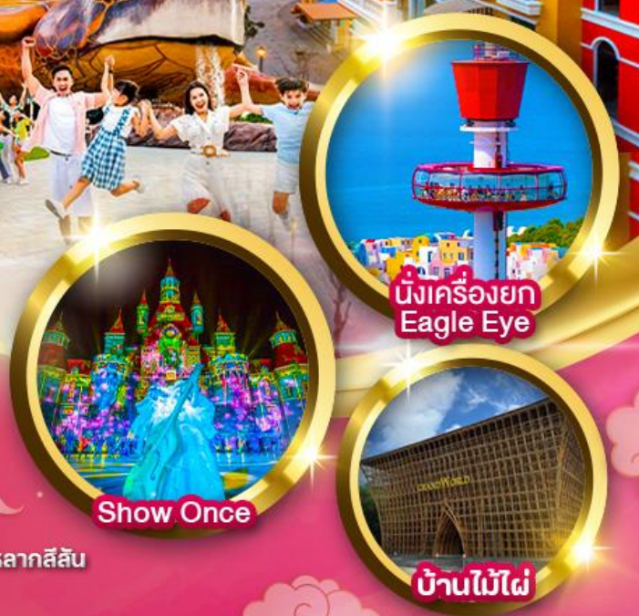
นั่งเครื่องยก Eagle Eye

"เวนิสแห่งเอเชีย" Grand World Phu Quoc สถาปัตยกรรมสโตนียุโรปหลากสีสัน