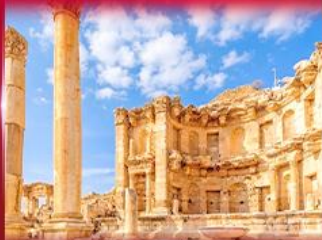
เมืองโบราณเจราซ