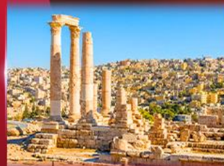
ป้อมปราการอัมมาน