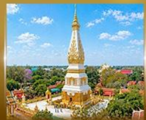
พระธาตุพนมวรวิหาร