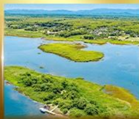
เกาะดอนโพธิ์