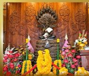
ศาลเจ้าปู่ซิ่งลือ นาคราช