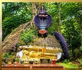
วัดท่าชัยมงคล