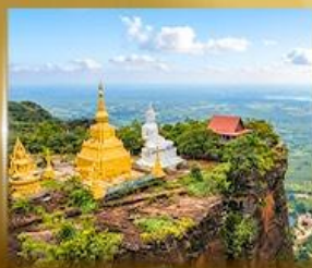
เจดีย์หลวงปู่เสาร์