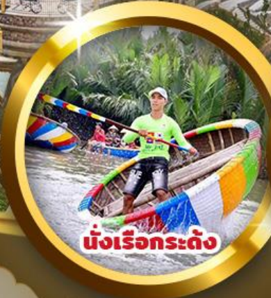
นั่งเรือกระดง