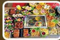
ปิ้งย่าง BBQ