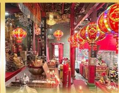
ศาลเจ้ากวนอู คลองสาน