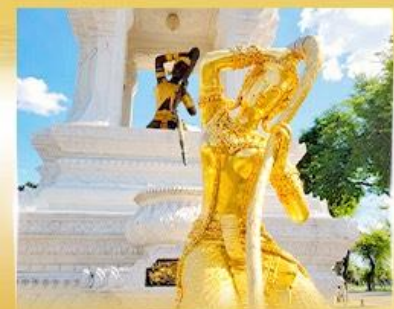
พระแม่ธรณีบีบมวยผม