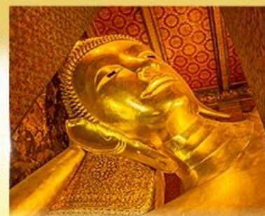
วัดพระเชตุพนวิมลมังคลาราม (วัดโพธิ์)