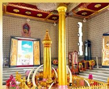
ศาลหลักเมือง กรุงเทพมหานคร