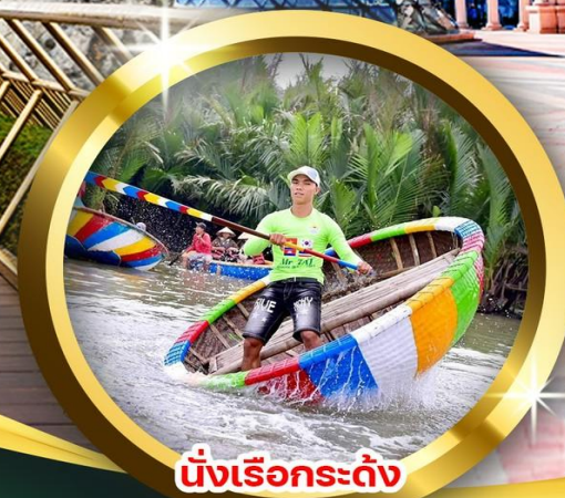
นั่งเรือกระดิ่ง